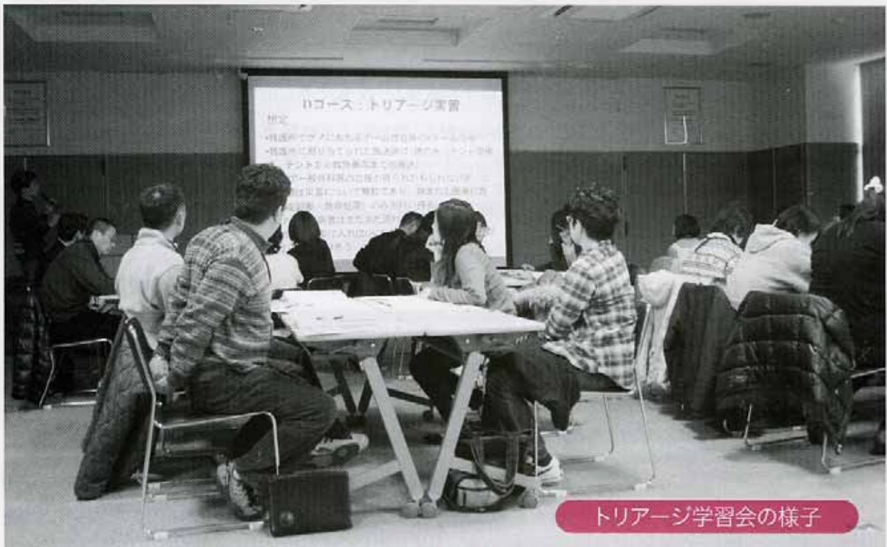
トリアージ学習会の様子